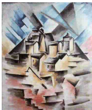
Josef Čapek kubistický...